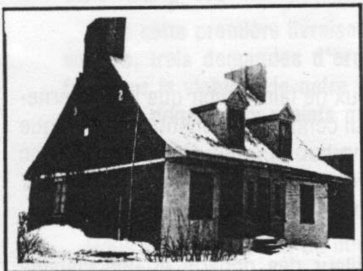
Maison à Pointe-aux-Trembles de Jacques Archambault, petit-fils de l'ancêtre.