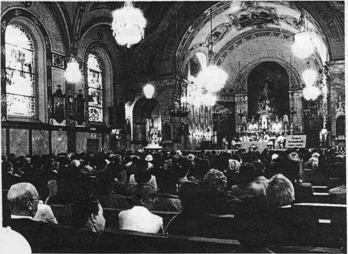
L'Assistance à Notre-Dame-de-Bon-Secours.