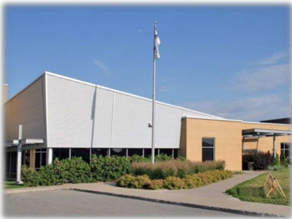
Bibliothèque municipale et scolaire Edmond-Archambault de Repentigny 213, boul. J.A. Paré, Repentigny.

Des Maisons d'Archambault par Pierre Archambault, membre numéro 007 Numéro 5