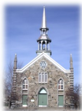
Église de Saint-Paul-l'Ermité Construite en 1858 par François Archambault de L'Assomption, d'après les plans de Joseph Michaud

Georgiana Saint-Joseph, Montréal 14-05-1900 Cyrille Lachapelle