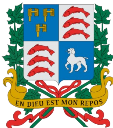
Armoiries de Saint-Roch-de-l'Achigan

Pierre Saint-Roch-de-l'Achigan 26-05-1806 Joseph Foucher