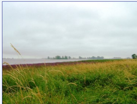
Les battures de l'île Lebel au fleuve Saint-Laurent

Repentigny se trouve sur les rives du fleuve Saint-Laurent et de la rivière l'Assomption, à l'est de l'Île de Montréal. Sa position géographique est très avantageuse en raison de la proximité de l'Île de Montréal. Elle possède sept plages sur ses deux cours d'eau, et un secteur de la ville a reçu le nom de Repentigny-les-Bains.