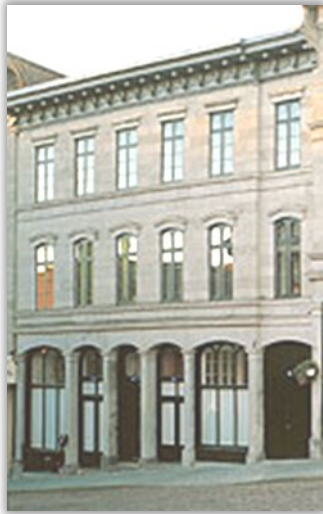
Édifice Marie-Paule Nolin (née Archambault)