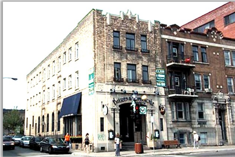
Il est gravé sur la pierre taillée de l'édifice « Édifice Louis-Archambault, Société des artisans canadiens-français »