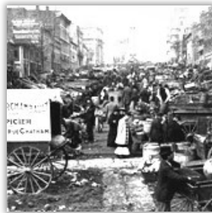
Place Jacques-Cartier Montréal