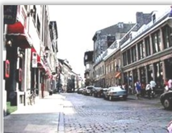
Le Vieux-Montréal

L'immeuble Archambault est situé tout près de la reproduction du puits creusé à l'automne 1658 par notre ancêtre Jacques Archambault, à côté du musée de la Pointe-à-Callière.