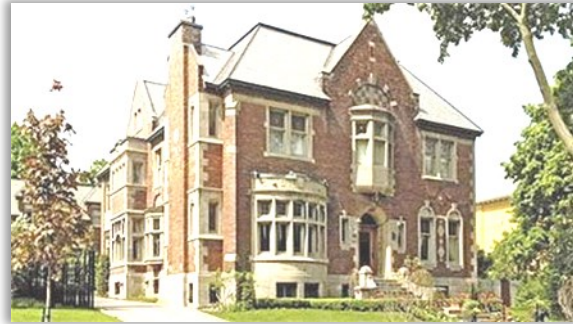
Patrimoine architectural de Montréal