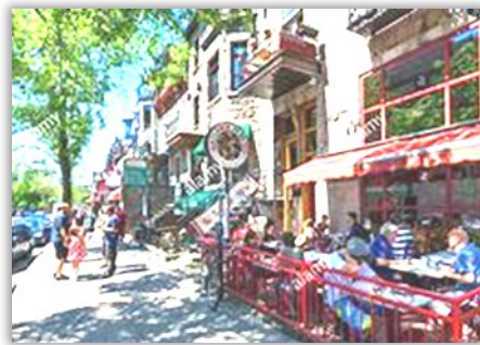
Rue Saint-Denis, Montréal