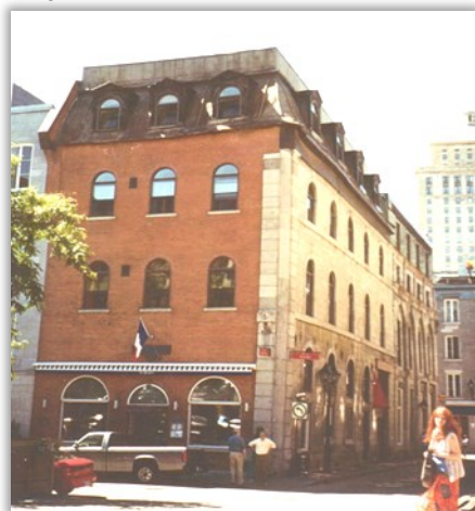
Immeuble Archambault, 351, place D'Youville, angle de la rue Saint-Pierre.

Construit en 1854 par un dénommé A. Archambault, le bâtiment servait de magasin-entrepôt. Il compte cinq étages, et le matériau dominant est la pierre sur le côté est, rue Saint-Pierre.