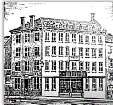
Hôtel Donegana. Wikipédia, l'Encyclopédie libre